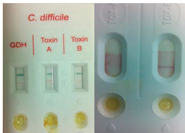
Рисунок 1. ИХА-тест система для диагностики C. difficile

Определение ГДГ в образцах просветных фекалиях не позволяет судить о токсигенности C. difficile . Токсины А/В в стуле больных определяют посредством ИФА и/или ИХА, бактериологическим методом, с последующим определением токсигенности чистой культуры C. difficile в ПЦР или биологическому действию (ЦПД) (УУР А, УДД Ы) [12,28,83]. ИФА для детекции токсинов быстр, не трудоёмок по сравнению с бактериологическим методом, но имеет низкую чувствительность. Чувствительность ИФА составляет 63-95%, специфичность 75-98%. Для детекции токсинов А и В C. difficile используют ИФА, которые позволяют определять токсин А, либо токсин В или оба токсина. Предпочтительнее использовать тест-системы, одновременно детектирующие оба токсина, поскольку встречаются токсигенные штаммы C. difficile , вызывающие заболевание и продуцирующие токсин А, который не детектируется серологическим методом. Такие штаммы имеют мутацию гена tcdA в 139-й позиции (УУР А, УДД Ы) [4141,72,73,78].